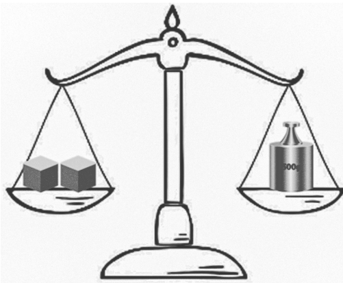
Слика 2. Пример проблема мерења масе

Након тога учитељ може затражити од ученика да представе ову ситуацију тако што ће нацртати једноставну слику ваге и помоћу симбола представити предмете и њихове масе. Овај корак представљао би визуелизацију ситуације и разумевање односа који постоје између маса на тасовима ваге. Од ученика се може тражити да се ситуација изрази тако да се непознате величине изразе симболички, чиме би се створила ситуација за увођење једначине којом би се алгебарском нотацијом представила реална проблемска ситуација вагања маса. У конкретној ситуацији, једначина може изгледати овако: